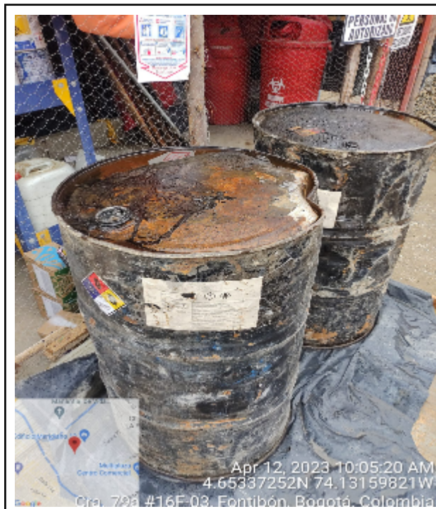
Foto No. 11. Área de almacenamiento de residuos peligrosos