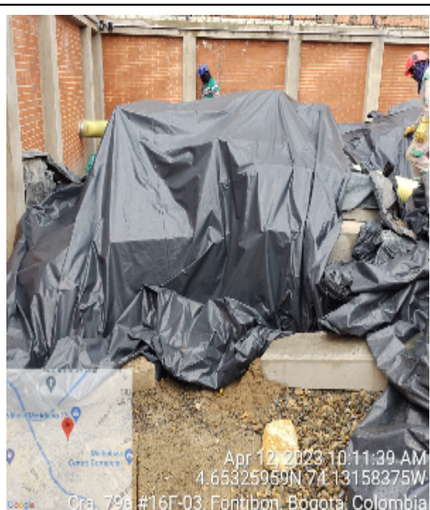
Foto No. 12. Residuos ordinarios almacenados a la intemperie