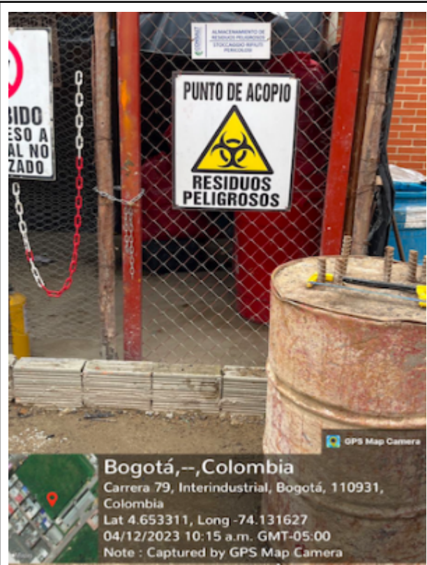
Foto No. 8 Área de almacenamiento de residuos peligrosos