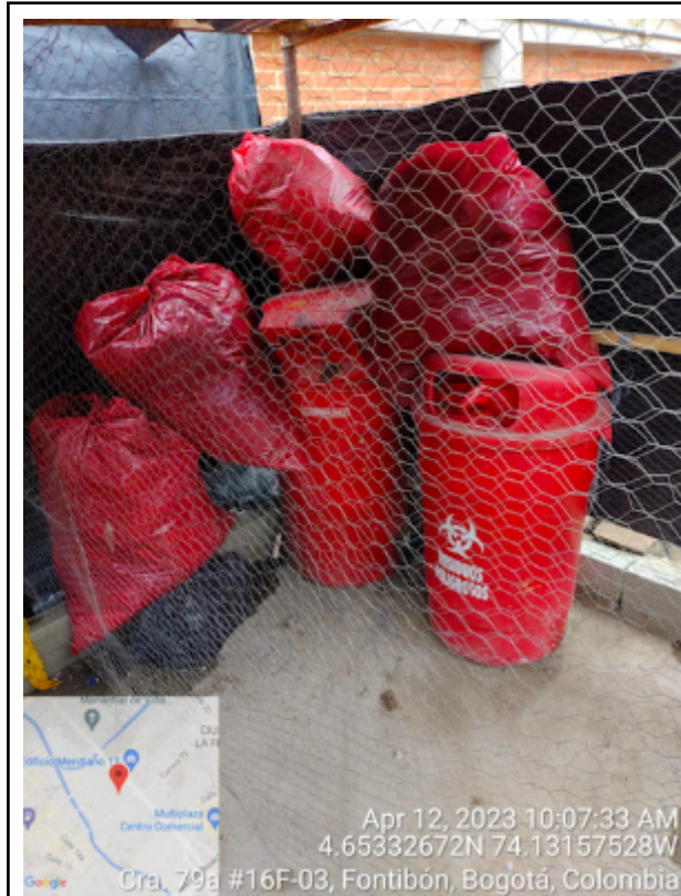
Foto No. 7 Área de almacenamiento de residuos peligrosos con Respel sin estar adecuadamente etiquetados