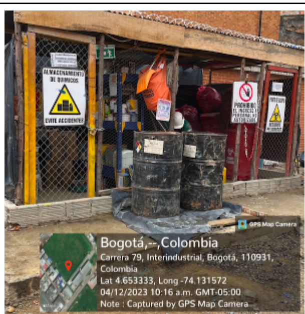
Foto No. 10 Área de almacenamiento de residuos peligrosos