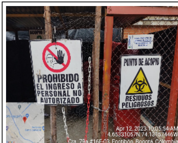
Foto No. 9 Área de almacenamiento de residuos peligrosos